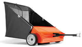
МУСОРОПОДБОРЩИК/ ТРАВΟΣБОРНИК 586 63 65-01