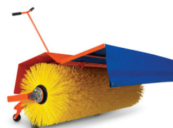
ЩЕТКА РАЙДЕРА R 420TSX AWD (2019-) 120CM 596 28 87-01