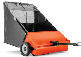
SWEEPER 582 71 99-01