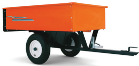
ПРИЦЕП 275 501 00 82-01