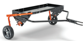
ATTACHMENT PLATFORM 586 63 72-01