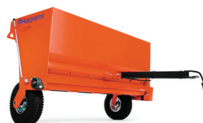
РАЗБРАСЫВАТЕЛЬ ПРОФИ К R 420TSX AWD (2019-) 596 29 30-01