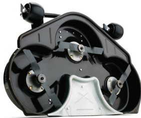
ДЕКА COMBI 122CM К РАЙДЕРУ R 420TSX AWD (2019-) 967 64 91-01