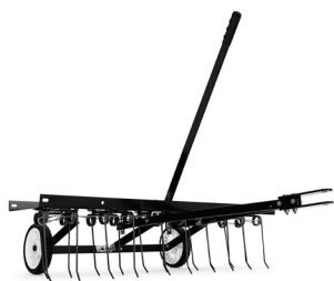
ПРИЦЕПНЫЕ РАБЛИ ДЛЯ МХА (ДЛЯ ВСЕХ МОДЕЛЕЙ) 586 63 66-01