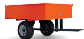
ПРИЦЕП PROFİ 953 51 17-02