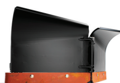
СНЕГООТБРАСЫВАТЕЛЬ ПРОФИ К РАЙДЕРУ R 420TSX AWD (2019-) 596 28 93-01