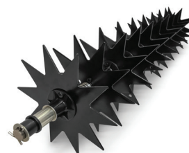
AERATOR 586 63 69-01