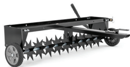
СКАРИФИКАТОР 586 63 67-02