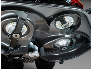
ДЕКА COMBI 112CM К РАЙДЕРУ 420TSX AWD (2019-) 967 64 90-01